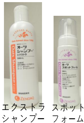
エクストラ シャンプー スポット フォーム

健康なわんちゃんのシャンプーです。被毛に鮮やかな光沢をもたらし、うるおいを保つことを目的としたシャンプーです。皮膚の乾燥を防ぐことで皮膚の痒みをやわらげることがを助けます。